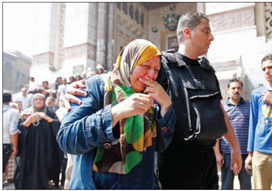
أحد عناصر الأمن يحنو على امرأة بعد خروجها من الاعتصام داخل مسجد الفتح بالقاهرة

القاهرة-وكالات: قال مصطفى حجازي مستشار الرئيس المصري المؤقت أن مصر تواجه حرباً شنتها قوى متطرفة واستواجهها من خلال الاجراءات الامنية في اطار القانون. وأكد حجازي التزام الدولة المصرية بحماية المصريين من الإرهاب الديني أو الإرهاب باسم الدين مجدداً تعهده أمام الشعب المصري بالوفاء بخارطة الطريق. وقال فوضي رئيس الوزراء المصري الدكتور حازم الببلاوي وزير الداخلية اللواء محمد إبراهيم باتخاذ كل ما يلزم في إطار القانون والدستور لإرجاع الأمور في مصر إلى نصابها الصحيح، مشدداً على رفض المصالحة مع من تولت أيديهم بالدماء ورفع السلاح في وجه الدولة المصرية. وأكد خلال مؤتمر صحافي، بمقر الحكومة، على أن اعتصام الإخوان برباعة العدوية والنهضة، لم يكونا اعتصامين فقط بل كانا تهديداً للأمن القومي للبلاد، مشيراً إلى أن الدولة ساهمت في خلق المزيد من المبادرات لحلحلة الأزمة السياسية. ووصف الببلاوي الجمعة، بأنه عصب، حيث تمت مهاجمة المنشآت العامة واضرام النيران