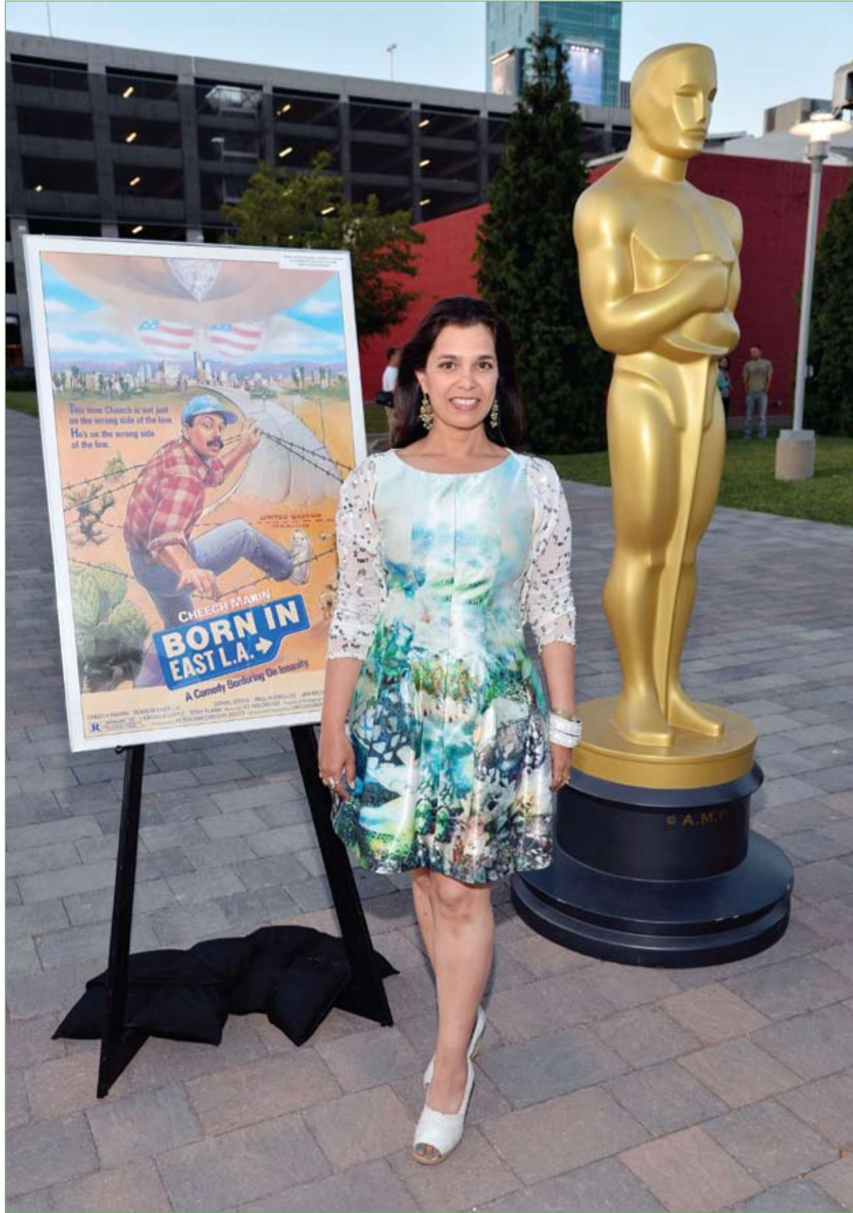
الممثلة كامالا لوبيز لدى وصولها أكاديمية الفنون والعلوم لحضور حفل توزيع جوائز الأوسكار خلال عرض فيلم Born In East L.A. في هوليوود.

رغم بلوغه من العمر 79 عاما قام لبناني يقتل زوجته العجوز التي تبلغ من العمر ايضا 79 عاما وقد عثر على جثة الزوجة مصابة بطلق ناري في رأسها. داخل غرفة نومها وتم توقيف زوج الضحية ويحوزته المسدس المستخدم في الجريمة، وبدأ التحقيق معه لمعرفة أسباب الجريمة .